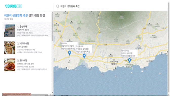
그림 3. 시스템의 효능 검색 결과 화면

사용자가 검색창에 효능을 검색하면 해당 효능을 제공할 수 있는 좌측 향토음식점의 목록과 지도 이미지가 나타난다. 향토음식점 목록에서는 각 음식점이 제공하는 향토음식과 주소, 맛집 태그의 정보를 보여준다. 목록 옆 지도에서는 각 음식점들의 위치와 함께 업소명과 메뉴, 효능을 나타낸다. 이를 통해 사용자는 효능 정보와 음식점 정보를 한눈에 파악할 수 있다. 다음 그림은 '어린이 성장발육 촉진'의 효능을 검색했을 때의 결과 화면이다. 어린이 성장발육 촉진과 관련된 식재료는 갈치이며 해당 식재료로 만든 향토음식인 갈치조림 등을 제공하는 식당이 검색됐다.