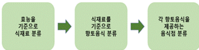
그림 1. 데이터 통합 프로세스

이렇게 전처리 과정을 거친 각 데이터들의 연결하여 통합한다. 다음 그림은 데이터들의 통합 작업 흐름을 나타낸 것이다. 이렇게 통합된 데이터는 데이터베이스에 저장된다.